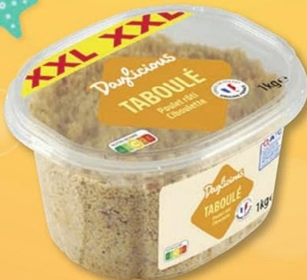
DAYLICIOUS (B) TABOULÉ (B) Poulet rôti et ciboulette. Réf. 5006704