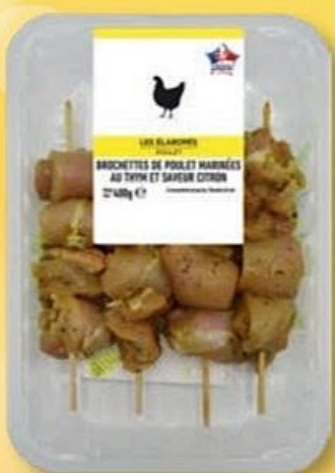
BROCHETTES DE POULET MARINÉES (A) Au thym et saveur citron. Réf. 5025208