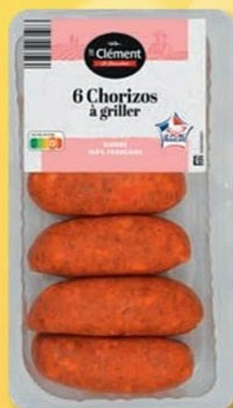
ST-CLÉMENT LE BOUCHER (B) CHORIZO (B) À griller. Réf. 6044