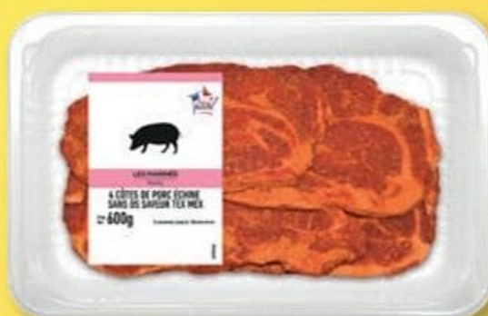
4 CÔTES DE PORC ÉCHINE SANS OS (B) Marinées Tex Mex. Réf. 5024429