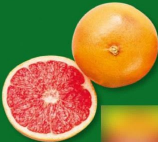
POMÉLO (D) Variété Star Ruby. Catégorie 1. Calibre 93/110 mm. Ref. 6148