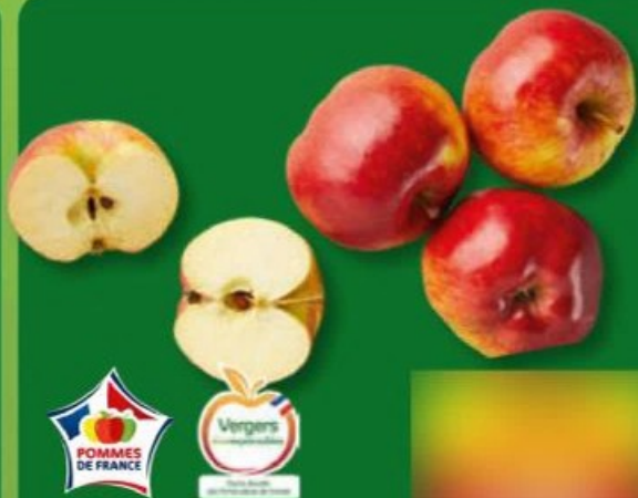
POMMES À CUIRE (C) Variétés Reinette grise du Canada ou Belle de Boskoop. Catégorie 1. Calibre 115/150 g. Ref. 5020490