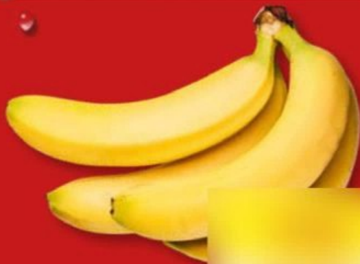
BANANES (A) Variété Cavendish. Catégorie 1. Calibre P20. Produit vendu en vrac. Ref. 6322

DES FRUITS ET LÉGUMES FRAIS TOUS LES JOURS