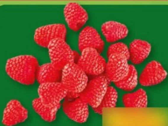
FRAMBOISES (B) Catégorie 1. Ref. 3229