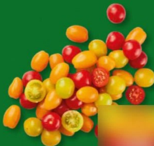
TOMATES CERISES MULTICOLORES (E) Catégorie 1. Réf. 4343