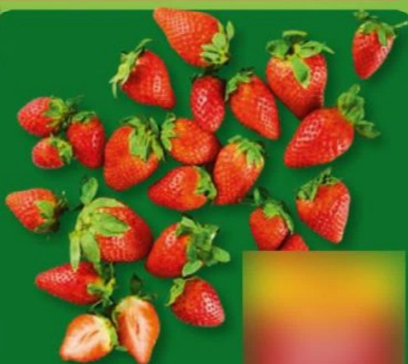
FRAISES (B) Catégorie 1. Réf. 9827