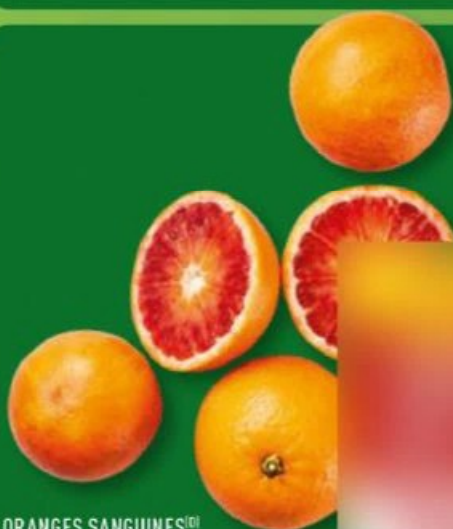
ORANGES SANGUINES (D) Variété Sanguinelli. Catégorie 1. Calibre 7/8 (64-76 mm). Réf. 5024250