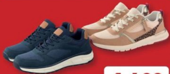
UP 2 FASHION® SNEAKERS Ex. de composition : Dessus : synthétique et textile. Intérieur : textile avec semelle en mémoire de forme. Du 37 au 45. Ref. 5014699 / Ref. 5014693