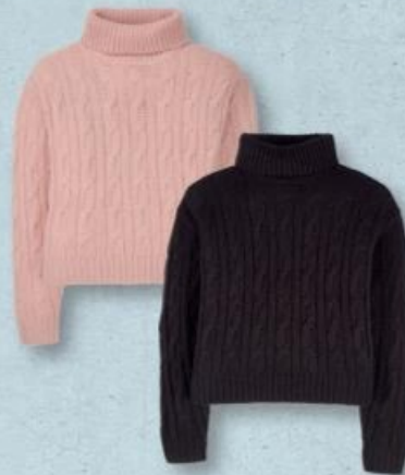
UP 2 FASHION® PULL ★ 100% coton. Du S au XL. Ref. 5021458