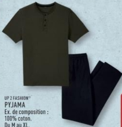
UP 2 FASHION® PYJAMA Ex. de composition : 100% coton. Du M au XL. Ref. 5014702