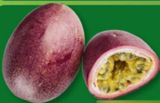
FRUITS DE LA PASSION (C) Catégorie 1. Réf. 6235