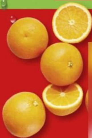
ORANGES (A) Variété Naveline. Catégorie 1. Calibre 5/6 (70-84mm). Réf. 6109

DES FRUITS ET LÉGUMES FRAIS TOUS LES JOURS