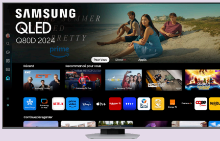
TV QLED 55" / 138 CM SAMSUNG TQ55Q80D 799€ - 15% de remise soit 679€15 dont 17€51 d'éco-participation