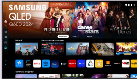
TV QLED 65" / 163 CM SAMSUNG TQ65Q60D 849€ - 15% de remise soit 721€65 dont 17€51 d'éco-participation