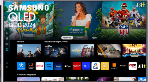
TV QLED 75" / 189 CM SAMSUNG TQ75QE1D 1090€ - 15% de remise soit 926€50 dont 17€51 d'éco-participation