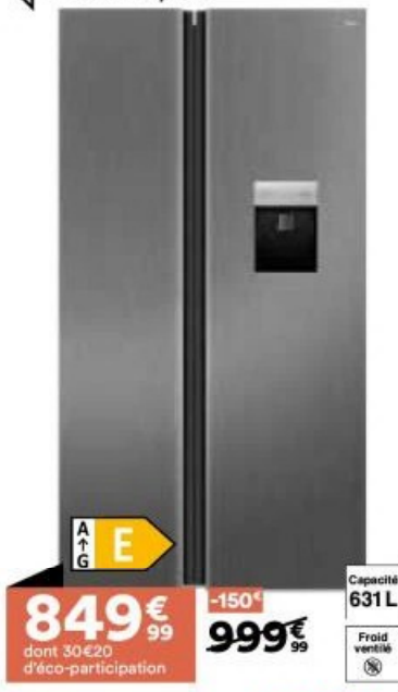
14. Réfrigérateur américain

Le + Distributeur d'eau : réserve de 2,5L d'eau à disposition sans ouvrir la porte