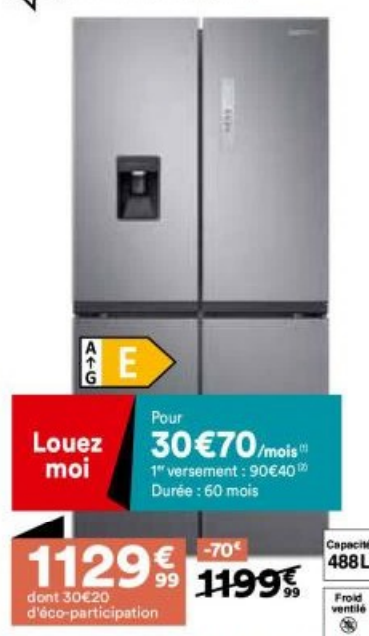
15. Réfrigérateur multi-portes

Le + Distributeur d'eau avec réservoir et fabrique de glace