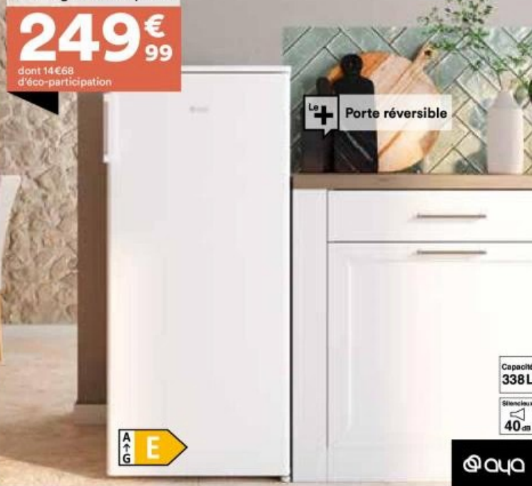
11. Réfrigérateur 1 porte