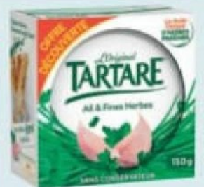
TARTARE "Offre Découverte" TM Ail et fines Herbes ou Noix et Amandes, à partir de 34,5% M.G. dans le produit fini, 150 g. Soit les 2 produits : 3,07 € Soit le kg : 10,23 €