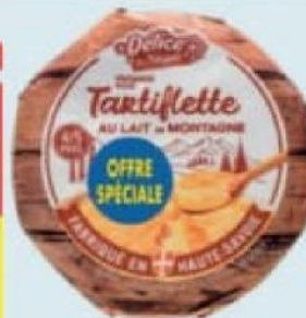
Fromage Tartiflette "Offre Spéciale" TM DÉLICE DES NEIGES 26% M.G. dans le produit fini, 440 g. Soit les 2 produits : 8,26 € Soit le kg : 9,39 €