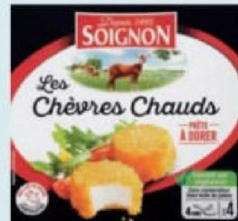
Les Chèvres Chauds TM SOIGNON 23% M.G. dans le produit fini, 4 x 25 g. Existe aussi en Croustis Chèvres, 23% M.G. dans le produit fini, 100 g.