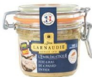
Foie gras de canard entier JEAN LARNAUDIE Emblématique, 170 g.