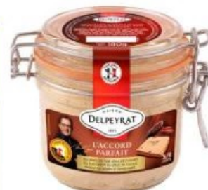
Foie gras DELPEYRAT L'accord parfait, au poivre fraîchement moulu ou à l'Armagnac millésimé, 180 g.