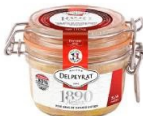
Foie gras de canard entier DELPEYRAT Nature, Sel de Guérande ou au Poivre fraîchement moulu, 110 g