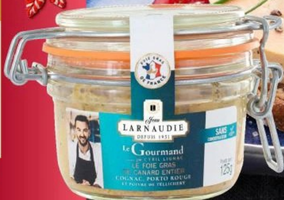
Foie gras de canard JEAN LARNAUDIE Gourmand, 125 g.