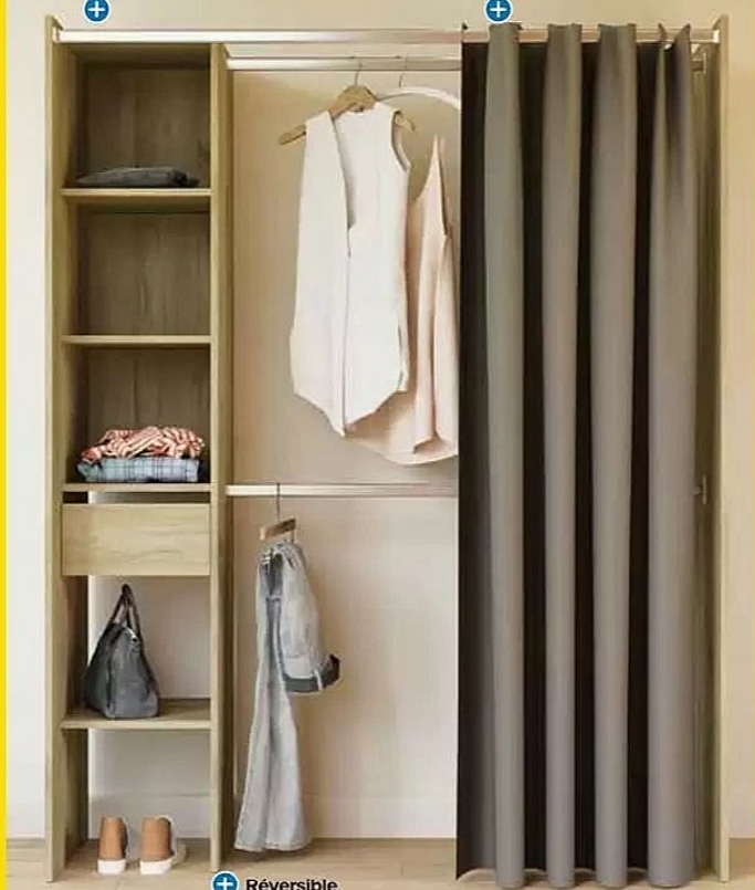
Kit dressing Romo 1 colonne réversible coloris chêne kronberg L. 144,2 x H. 183 x P. 50 cm Réf. 3397703381565. À monter soi-même. Quantité limitée 7920 pièces*