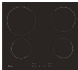
Table de cuisson vitrocéramique 249***