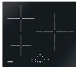
Table de cuisson induction 279***