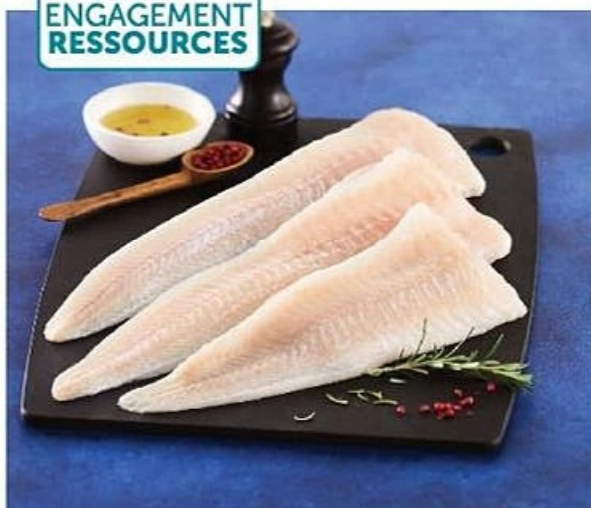
FILET DE JULIENNE (4)(6) 13€ ,95 LE KG