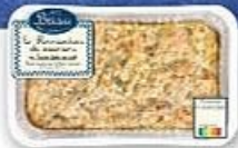
PARMENTIER DE SAUMON (5) La barquette de 750 g Le kg : 9,32 € 6€ ,99 LA BARQUETTE