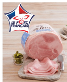
JAMBON CUIT SUPÉRIEUR DÉCOUENNÉ SEL RÉDUIT LE FOUÉ PAUL PRÉDAULT (A)(B) 10€ ,99 LE KG