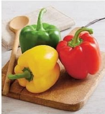
POIVRON PANACHE (A) Calibre : 70/90 mm Catégorie : 1 Le sachet de 500 g