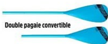
Double pagaie convertible