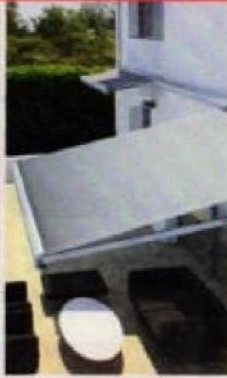
STORES BANNES CIOTAT ET AIX