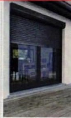
VOLETS ROULANTS ET BATTANTS