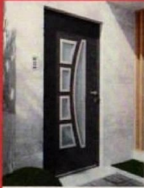
PORTES D'ENTRÉE ACIER, ALUMINIUM, BOIS ET PVC (HORS PORTES CONNECTÉES)

Jusqu'à -10% Sur la menuiserie standard (2)