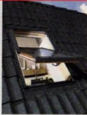
FENÊTRES DE TOIT ET ACCESSOIRES