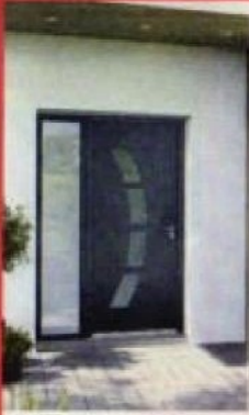
PORTES D'ENTRÉE (HORS PORTES BLINDÉES)

Jusqu'à -15% Sur la menuiserie sur mesure (2)