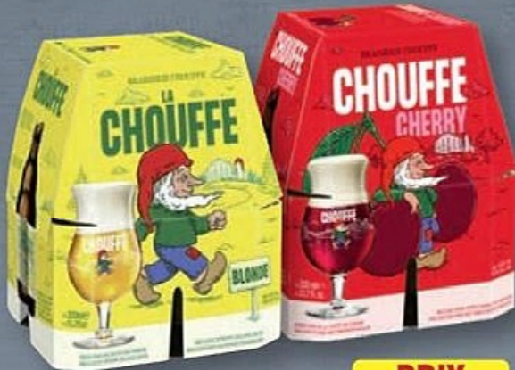
CHOUFFE® BIÈRE BELGE BLONDE OU AROMATISÉE À LA CERISE 8° ☼ Le pack de 4 x 33 cl. Ref. 5024034 / Ref. 5024031