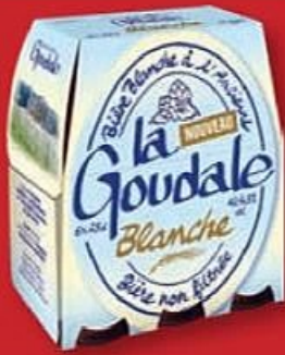
LA GOUDALE® BIÈRE BLANCHE 4,5% ☼ Le pack de 6 x 25 cl. Ref. 5021953