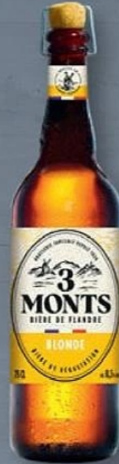
3 MONTS® BIÈRE BLONDE DE DÉGUSTATION 8,5° ☼ Ref. 7484