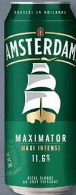
AMSTERDAM® BIÈRE BLONDE 11,6° ☼ Ref. 5026407