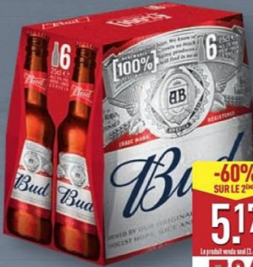
BUDWEISER® BIÈRE BLONDE 5° ☼ Le pack de 6 x 25 cl. Ref. 5009982