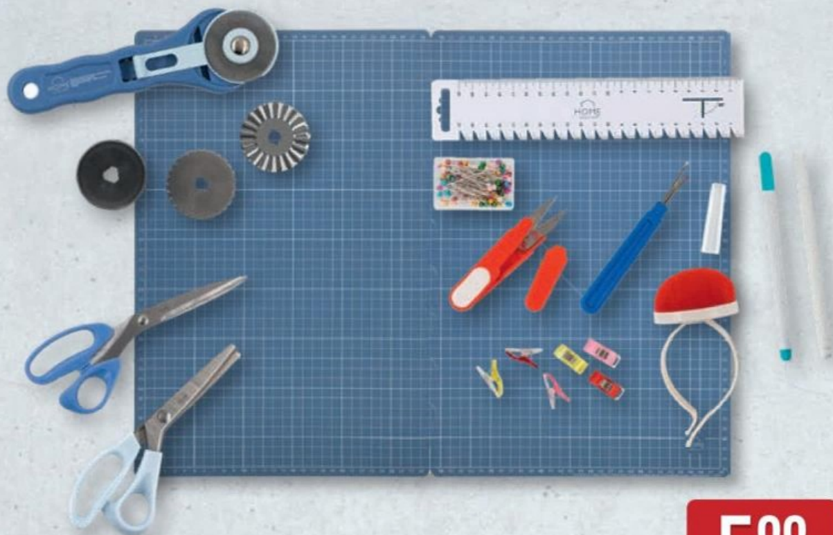
HOME CREATION® ACCESSOIRES DE COUTURE ✪ Au choix : tapis de découpe, cutter rotatif, kit de couture ou 2 paires de ciseaux. Ref. 5007113