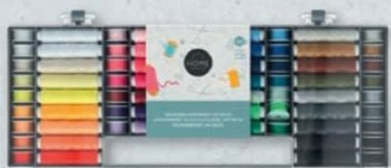
HOME CREATION® ASSORTIMENT DE FILS À COUDRE ✪ Composé de 32 bobines de fil à coudre (env. 50 m) et 32 bobines de fil de canette (env. 25 m). Ref. 5018476