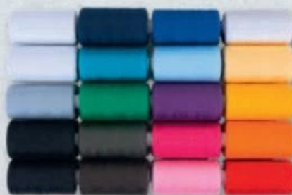
HOME CREATION® FILS POUR MACHINE À COUDRE ✪ Au choix : pour surjeteuse ou machine à coudre. Ref. 5013470