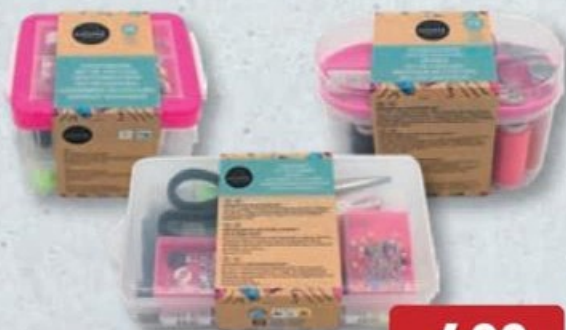
HOME CREATION® SET DE COUTURE ✪ Plusieurs modèles disponibles. Ref. 5018491