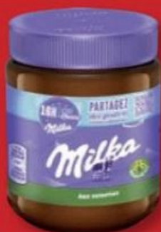
PÂTE À TARTINER MILKA® Aux noisettes. Le produit de 340 g. Ref. 5014547