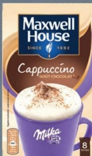
MAXWELL HOUSE® 8 STICKS CAPPUCCINO MILKA® ☼ Ref. 5018217