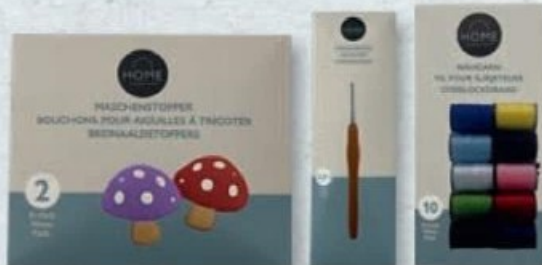
HOME CREATION® ACCESSOIRES DE COUTURE ✪ Au choix : fermetures éclair, aiguilles à tricoter circulaires, crochet, patches à repasser, aiguilles de couture, ruban thermocollant, fils pour surjeteuse, etc. Ref. 5021222