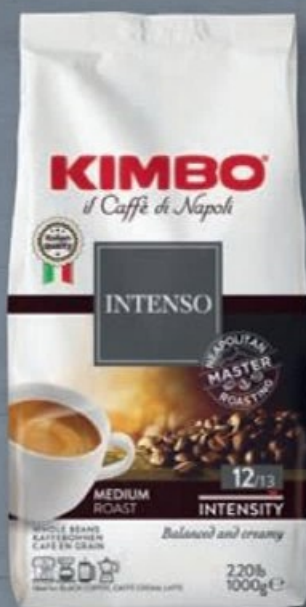
KIMBO® CAFÉ EN GRAINS INTENSO ☼ Ref. 5089401