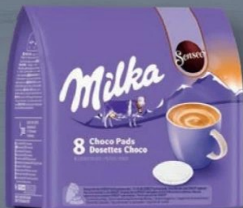
8 DOSETTES SENSED® MILKA ☼ Ref. 5014236