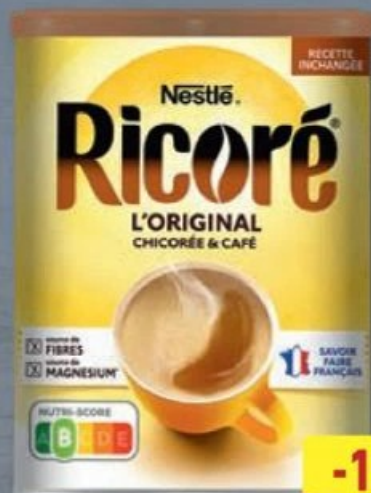
NESTLÉ® RICORÉ® Ref. 4756