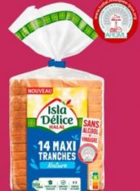
Pain de mie Halal (n) ISLA DÉLICE 14 Maxi tranches, 550 g. Soit les 2 produits : 2,73 € Soit le kg : 2,48 €