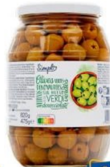
Olives vertes SIMPLY Dénoyautées, 475 g.