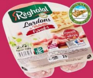
Lardons de volaille Halal (n) RÉGHALAL Fumés, 150 g. Existe aussi en Lardons de poulet nature.