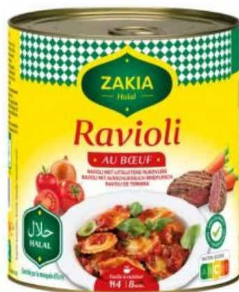
Raviolis cuisinés Halal ZAKIA Bœuf ou Volaille, 800 g.