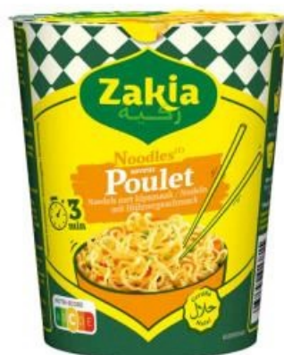
Noodle Halal ZAKIA Poulet, Bœuf ou Curry, 67 g. Soit les 2 produits : 1,70 € Soit le kg : 12,69 €