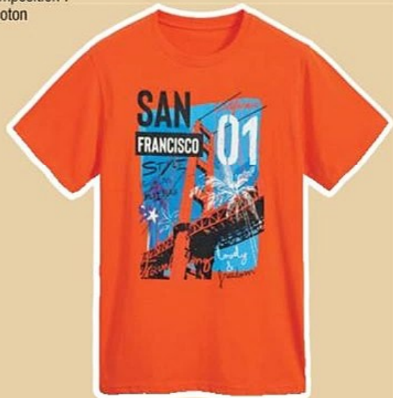
TEE-SHIRT du S au XXL, vendu seul à 5 €