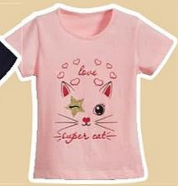
TEE-SHIRT du 3 au 14 ans, vendu seul à 4 €