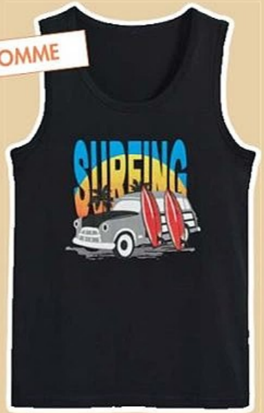
DÉBARDEUR du S au XXL, vendu seul à 4,50 €