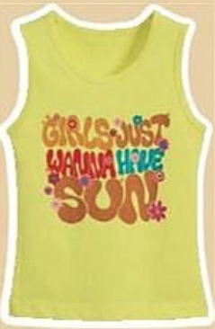
DÉBARDEUR du 3 au 14 ans, vendu seul à 3,50 €