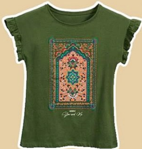
TEE-SHIRT du 38/40 au 50/52, vendu seul à 7 €