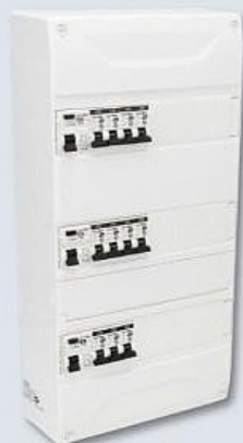
TABLEAU PRE-EQUIP T3 3R 39 MOD NOVELEC

TABLEAU PRE-EQUIP T3 3R 39 MOD NOVELEC, tableau électrique 3 rangées, 39 modules, blanc mat, adapté aux logements T3/T4, avec interrupteurs différentiels et clé d'ouverture.