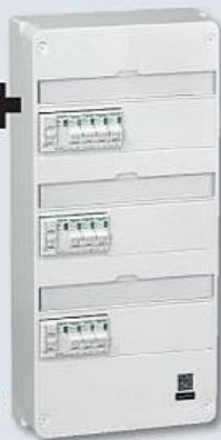
TABLEAU MONTÉ CÂBLÉ 3 RANGÉES 39 MODULES T3/T4/T5

Répond aux exigences d'installation de la norme NF C 15-100