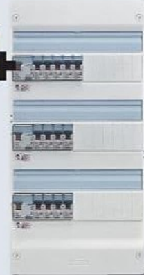
TABLEAU MONTÉ CÂBLÉ 3 RANGÉES 39 MODULES T5

Équipé de 1 interrupteur différentiel NF 40A, 30mA (type AC), 2 interrupteurs différentiels NF 63A, 30 mA (1 type AC, 1 type A) et 13 disjoncteurs NF (3 x 10A, 5 x 16A, 4 x 20A, 1 x 32A). Ref. 3414970767608