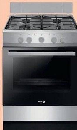
Table 4 feux gaz Four 74 L Catalyse Convection naturelle A Energie

520€* -80€ DE REMISE IMMÉDIATE 449€90 DONT ÉCO-PARTICIPATION 14,84 €