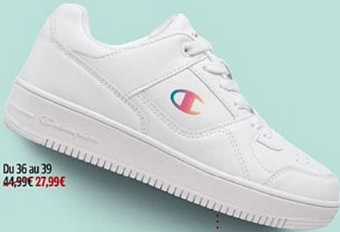
Du 36 au 39 44.99€ 27.99€