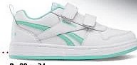
Du 28 au 34