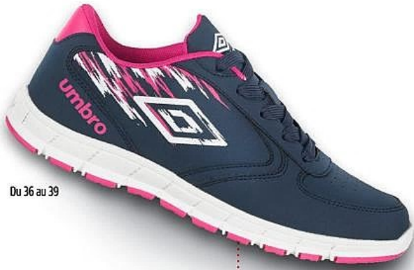
Du 36 au 39