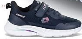
Du 28 au 35