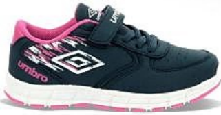
Du 22 au 35