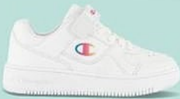
Du 28 au 35