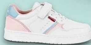
Existe en modèle lacets élastiques/scratch du 28 au 34 Existe en modèle lacets du 35 au 39