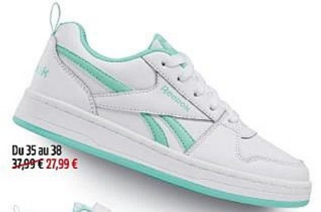
Du 35 au 38 37.99€ 27.99€