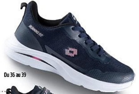
Du 36 au 39