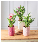
ARUM Hauteur : 40 cm Diamètre pot : 12 cm Pot céramique Variétés au choix 9 € ,99 LA PLANTE