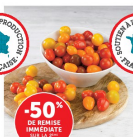
TOMATE CERISE MELANGÉE (D) Catégorie : Extra La barquette de 350 g