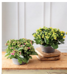
KALANCHOE Hauteur : 25 cm Diamètre coupe : 23 cm 9 € ,99 LA PLANTE