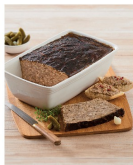
PÂTÉ DE CAMPAGNE LE GRIS OU TERRINE DE CAMPAGNE AU POIVRE VERT U (A)(B) 10€ ,99 LE KG