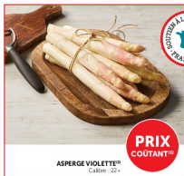
ASPERGE VIOLETTE (A) Calibre : 22+