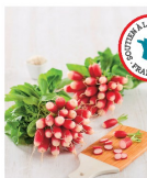
RADIS ROSE (C)