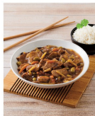
PORC AU CARAMEL OU POULET SAUCE LAIT DE COCO ET CURRY (A)(B) 13€ ,49 LE KG