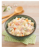
SALADE PIÉMONTAISE OU DUO ANANAS CAROTTES SURIMI OU MUSEAU DE PORC SAUCE VINAIGRETTE (A)(B) 7€ ,79 LE KG