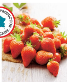
FRAISE GARIGUETTE (E) Catégorie : 1 La barquette de 250 g