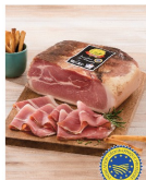
JAMBON DE VENDÉE À L'ANCIENNE IGP (A)(B) 11€ ,99 LE KG