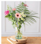
BOUQUET COMPOSÉ ZEBORA Hauteur : 50 cm 9 épis + 1 pic Couleurs variés 7 € ,99 LE BOUQUET