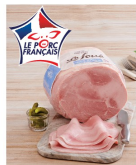
JAMBON CUIT SUPÉRIEUR DÉCOUENNÉ SEL RÉDUIT LE FOUÉ PAUL PRÉDAULT (A)(B) 10€ ,99 LE KG