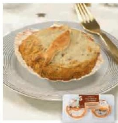
COQUILLE ST JACQUES À LA NORMANDE OU À LA BRETONNE (3)(A)

La pièce de 180g Le kg : 21,94 € (Également disponible en barquette de 2 pièces soit 300g, à 5,90€ soit 19,66€/kg)