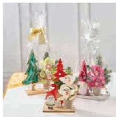
LA PLANTE PLANTE FLEURIE Hauteur : 25 cm Diamètre pot : 12 cm En cache-pot zinc MERRY Variétés au choix