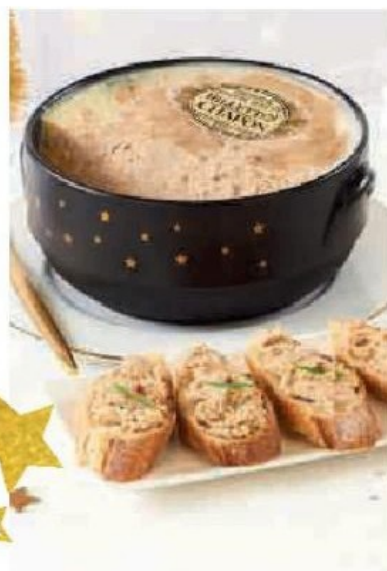
RILLETES DE CHAPON MARMITE OU RILLETES DE PORC À LA TRUFFE NOIRE DU PÉRIGORD (1,1%) (2)(A)

Au choix : Canard aux pistaches, Chevreuil aux cèpes, Chapon aux giroles ou Dinde aux marrons Également disponible au rayon frais emballé sur ces mêmes références à 3,09 € la barquette de 160 g soit 19,31€/kg