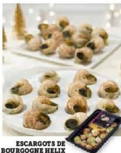
ESCARGOTS DE BOURGOGNE HELIX POMATIA BELLE GROSSEUR (3)(B)

Le plateau de 24 pièces, soit 250g Le kg : 43,96 €