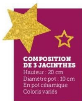
COMPOSITION DE 3 JACINTHES Hauteur : 20 cm Diamètre pot : 10 cm En pot céramique Coloris variés