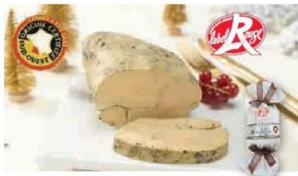
FOIE GRAS DE CANARD ENTIER IGP LABEL ROUGE DU SUD-OUEST PANACHE DES LANDES (1)(B)