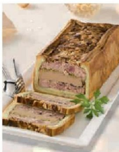
PATÉ CROUTE RICHELIEU OU FRANC COMTOIS MORILLES (3)(A)