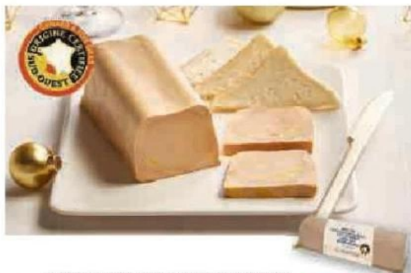
BLOC DE FOIE GRAS DE CANARD DU SUD-OUEST IGP 50% DE MORCEAUX MAISON MONTFORT (1)(A)

Également disponible au rayon frais emballé en 600 g à 34,49€ la barquette