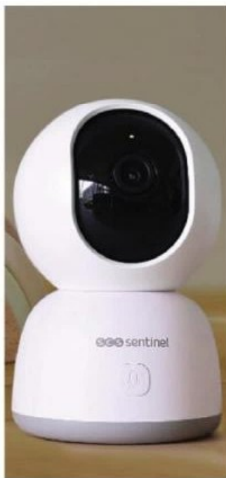
Image Full HD. Pilotable en wifi via l'application iSCS Sentinel. Détection de forme humaine, suivi de mouvement intelligent, visualisation de la vidéo à distance, fonction interphonie pour communiquer via la caméra, vision nocturne jusqu'à 7m. Angle de vue 75° horizontal, utilisation intérieure. Bouton disponible sur la caméra permettant de déclencher un appel vidéo.