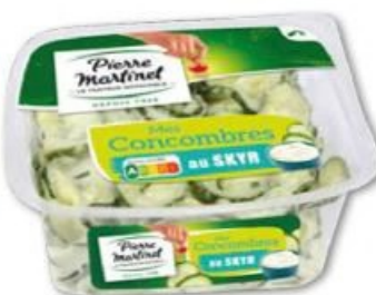
CONCOMBRES AU SKYR PIERRE MARTINET 300 g - 7,07 € le kg Offre valable sur d'autres variétés de la gamme, répondant à des caractéristiques et des prix différents, signalés en magasin.

DU VENDREDI 23 AU DIMANCHE 25 JANVIER 2026