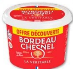
RILLETES DU MANS LA VÉRITABLE PUR PORC BORDEAU CHESNEL 400 g - 9,10 € le kg